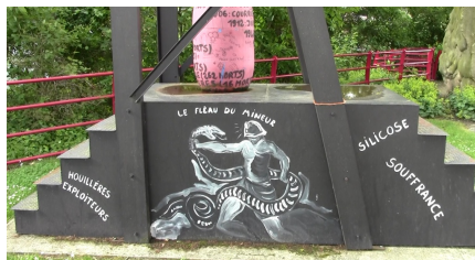
Table ronde « La mine dans le monde aujourd'hui, les accidents du travail, productivisme et désindustrialisation »

au pied du « chevalement-potence », symbole du sacrifice des mineurs sur l'autel de la rentabilité capitaliste